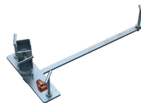
1. Nivelláló készlet (a kezdősor alatti habarcsréteg elkészítéséhez)

A habarcskeverék előállítása és a bedolgozás során használt eszközök tiszták legyenek! A bekevert habarcsot védeni kell a különböző szennyeződésektől.