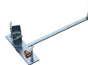
1. Nivelláló készlet (a kezdősor alatti habarcsréteg elkészítéséhez)

A habarcskeverék előállítása és a bedolgozás során használt eszközök tiszták legyenek! A bekevert habarcsot védeni kell a különböző szennyeződésektől.